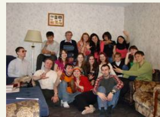
одна из домашних церквей